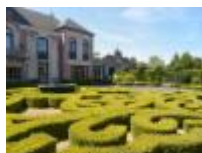
"Kasteel Ten Bosse" mooie vormen in buxus

Deinze, al eeuwenlang de stad van graan, meel, bloem