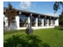
Hier staat het museum van Deinze en de Leiestreek

Wandelpad langs de Leie naar het centrum van de stad