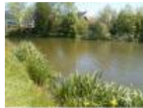
Water en groen, op wandelafstand van het centrum van Deinze

Tunneltje onder de spoorweg, kruispunt van fiets- en wandelroutes