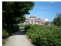
Wandelpad langs de Leie naar het centrum van de stad