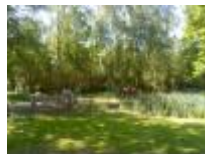
Altijd volk in de Brielmeersen

Links "de Leie" - Rechts "het Schipdonkkanaal"