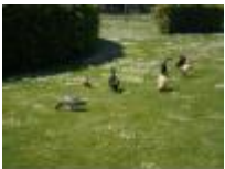
Hier wandel je dus gewoon tussen