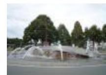
Fontein aan het "Kongoplein"

"Kasteel Ten Bosse" mooie vormen in buxus