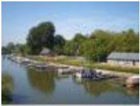
Tuutskiek en Yachthaven van Deinze