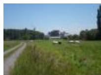
Deinze, al eeuwenlang de stad van graan, meel, bloem

Residentie "Leiedam" veilig wonen in prachtige seniorenflats