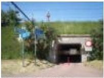
Tunneltje onder de spoorweg, kruispunt van fiets- en wandelroutes

Deinze, een stad vol kunst en beeldhouwwerken