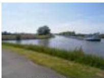
Links "de Leie" - Rechts "het Schipdonkkanaal"