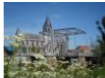
De Tolpoortbrug over de Leie