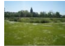
Achter de kerk van Petegem-aan-de-Leie