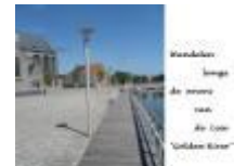
Wandelen langs de oevers van de Leie "Golden River"

Reynaert en Coppe, beeldhouwwerk (Chris Ferket)