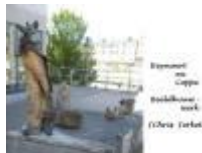
Reynaert en Coppe, beeldhouwwerk (Chris Ferket)