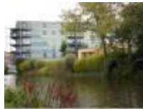
De achterkant van een stad

Water en groen, op wandelafstand van het centrum van Deinze