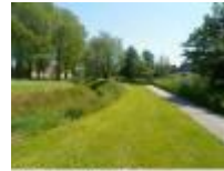
Veel groen rond en tussen de verschillende sportcomplexen

Een mooie constructie "Kunstwerk" Van alle kanten anders