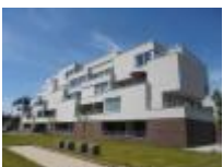
Residentie "Leiedam" veilig wonen in prachtige seniorenflats

Wandelen langs de oevers van de Leie "Golden River"