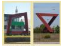
Een mooie constructie: kunstwerk anders: "Kunstwerk"

Een mooie constructie "Kunstwerk" Van alle kanten anders