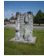
Deinze een stad vol kunst en beeldhouwwerken

Veel groen rond en tussen de verschillende sportcomplexen