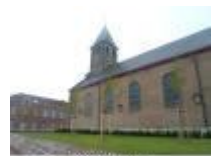
Sint-Amands en Sint-Jobkerk in Astene

Hoeve te Breetschoot in de Parijse Straat