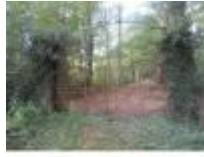
Ook nog enkele historische overblijfselen