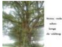
Mooie, oude eiken langs de veldweg

De rode vruchten van de gevlekte aronskelk