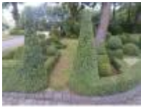
Opvallende vormsnoei van de buxus