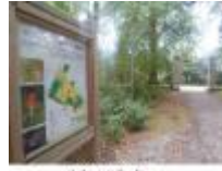
Informatieborden aan beide kanten van Astene Dreef

Ook nog enkele historische overblijfselen