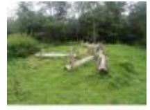
Hier kunnen de kinderen spelen