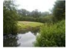
De omwalling van Gampelaerehoeve

Informatieborden aan beide kanten van Astene Dreef