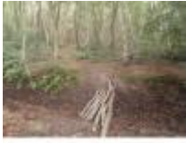
Hier kunnen de kinderen ravotten