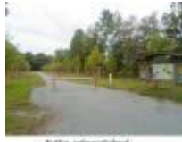
Nuttig informatiebord aan het stadsbos van Deinze

Mooie boerderij dicht bij het centrum van Astene