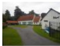
Hoeve te Breetschoot in de Parijse Straat