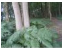
Wandelpadje tussen de varen in het bos

Eén van de vele paddenstoelen die je hier in de herfst kan zien