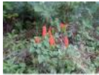
De rode vruchten van de gevlekte aronskelk