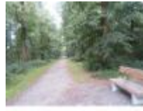
Gezellig wandelen in Astene Dreef

Nuttig informatiebord aan het stadsbos van Deinze