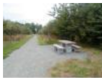
Af en toe een rustpunt onderweg