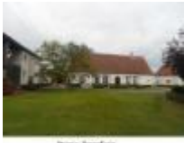
Bruus boerderij dicht bij het centrum van Astene

Mooie boerderij dicht bij het centrum van Astene