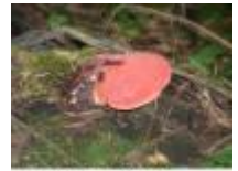
Eén van de vele paddenstoelen die je hier in herfst kunt zien

Eén van de vele paddenstoelen die je hier in de herfst kan zien