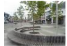
De Markt in Deinze

'Tolpoortbrug' gaat nog dagelijks open voor de scheepvaart