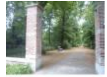
Toegang tot het stadsbos van Deinze

Astene Dreef, mooie omgeving om er te wandelen