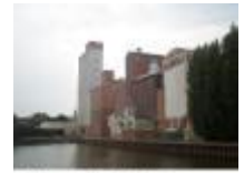
Industrieel erfgoed om te bewaren in het centrum van Deinze

Herinneringen aan oorlogen vindt je in elke stad