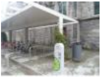
Deinze, duidelijk een fietsvriendelijke stad