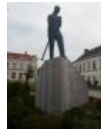
Herinneringen aan oorlogen vindt je in elke stad

Toeristische dienst voor Deinze en de Leiestreek