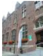
Toeristische dienst voor Deinze en de Leiestreek

Deinze, duidelijk een fietsvriendelijke stad