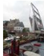
'Tolpoortbrug' gaat nog dagelijks open voor de scheepvaart