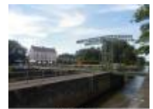
Astene Sas, de volledige omgeving is beschermd

Bloemmolens en veevoeders, historisch belangrijke industrietak