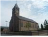
Sint-Amanduskerk in Astene