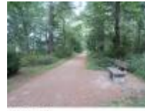
Astene Dreef, mooie omgeving om er te wandelen

Mooie boerderijen buiten het centrum van de stad