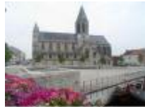
In het centrum van Deinze: ... de kerk ... de Leie ...

Eén van de weinige bewaarde historische gebouwen in Deinze