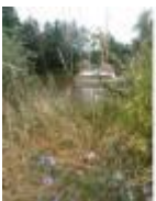
Veelzijdigheid van de Leie: natuur, toerisme, scheepvaart

Industrieel erfgoed om te bewaren in het centrum van Deinze