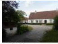
Mooie boerderijen buiten het centrum van de stad