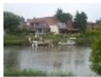
Langs de Leie wonen ... kan mooie gevolgen hebben

Veelzijdigheid van de Leie: natuur, toerisme, scheepvaart