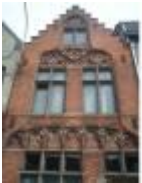
Eén van de weinige bewaarde historische gebouwen in Deinze