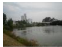
Bloemmolens en veevoeders, historisch belangrijke industrietak

Langs de Leie wonen ... kan mooie gevolgen hebben