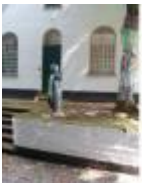
Kunst aan het schooltje in Deurle