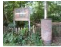
Toegang tot het Wandelbos in Deurle