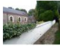
Cyriel Buysse pad naast de kerk in Deurle