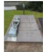
Grafsteen van schilder Gust De Smet