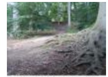
Zandduinen, Rivierduinen, Binnenduinen in het wandelbos