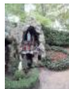
Stilte en rust aan de O-L-Vrouw Grot