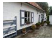
Ook in het dorpscentrum van Deurle