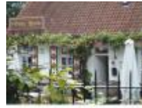
Gezellig plekje naast de kerk