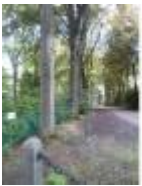
De Rode Beuken Dreef