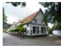
Deurle, je kan er eten, drinken, slapen