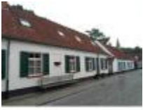
Het pittoreske dorpscentrum van Deurle