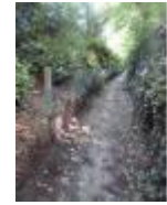
Kerkwegel door het bos