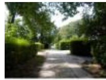
Typisch straatje in het schildersdorpje