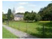
Sint-Aldegondis kerk in Deurle