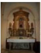
Mooi interieur in een goed onderhouden kerkje