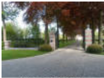
Mooie toegang tot kasteel "Hof ter Mere"