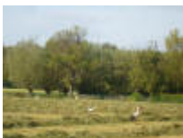
En met een beetje geluk, zie je naast de reigers ook wel eens ooievaars