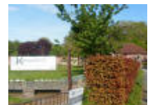
"Koetshuis" naast het kasteel van Ooidonk