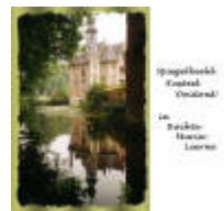
Kasteel Ooidonk in Bachte-Maria-Leerne