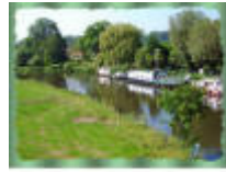
Yachthaven in Leerne