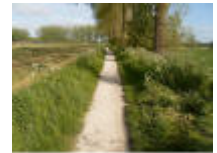
Padje voor enkel wandelaar en fietsers