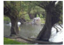
Ja, dat kan je hier ook nog zien