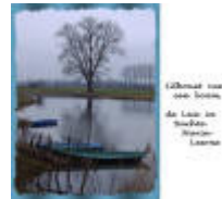
Silhouet van een boom