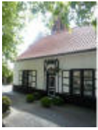
In het centrum van Bachte-Maria-Leerne