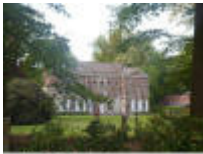
Kasteel "Crombrugge" in Sint-Martens-Leerne