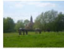
Hier zie je nog het Belgisch Trekpaard dicht bij de kerktoren