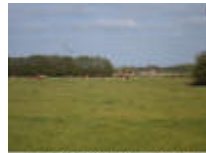
Je ziet hier altijd ergens een kerktoren en som wel twee of drie