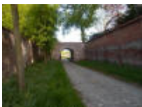
Brugje en toegangsweg tussen het kasteeldomein en het koetshuis