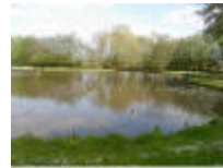
De Ijsput in Vosselare, een visvijver