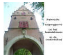
Historische toegangspoort tot het kasteeldomein in de Ooidonkdreef