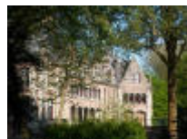
Kasteel "Ooidonk" één van de mooiste in België