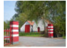
Gebouwen en hoeve "Oude stijl"