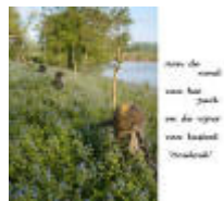
Aan de rand van het park en de vijver van kasteel "Ooidonk"