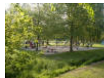
En ook nog een speelplein voor de kleintjes in de Ooidonkdreef