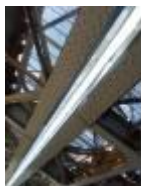
Wandelen onder de Vierendeelbrug, een constructie in vakwerk