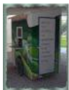
Roger Raveel, een van de grootste kunstenaars van deze tijd