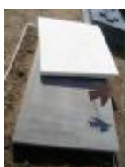
Grafsteen Roger Raveel, met een dwarsliggend wit marmeren vierkant