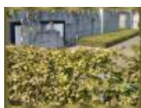
'De Muur Van Verbeelding' (Roger Raveel)