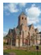
Sint-Jan Baptist, grote kerk voor klein dorpje, Grammene