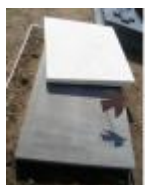
Grafsteen Roger Raveel, met een dwarsliggend wit marmeren vierkant