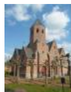
Sint-Jan Baptist, grote kerk voor klein dorpje, Grammene

Machelen, prachtige weerspiegeling van de kerk in de Leie