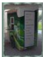
Roger Raveel, een van de grootste kunstenaars van deze tijd

Raveel, één van de grootste kunstenaars van deze tijd