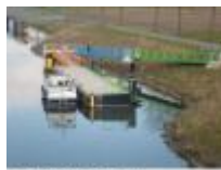
Aanlegsteigers in de Leie voor een bezoek aan Machelen

Wandelen onder de Vierendeelbrug, een constructie in vakwerk