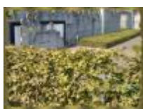
'De Muur Van Verbeelding' (Roger Raveel)

Grafsteen Roger Raveel, met een dwarsliggend wit marmeren vierkant