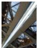
Wandelen onder de Vierendeelbrug, een constructie in vakwerk

Oude boom langs het wandelpad aan de Oude Leie