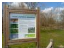
Oude Leiearm in Grammene, een mooi stukje natuur

Raveel, één van de grootste kunstenaars van deze tijd