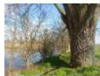
Oude boom langs het wandelpad aan de Oude Leie

Oude Leiearm in Grammene, een mooi stukje natuur