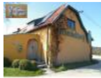
"Van Gompel" de pottenbakker