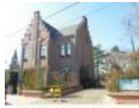
Mooi gebouw met toepasselijke naam "Rechts van de Kerk"