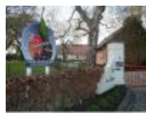
Fruitbedrijf "Cocquyt" in Meigem