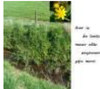
Maar in de lente, maar alle seizoenen zijn mooi