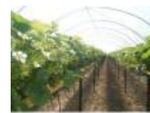
En het is hier ook de streek van aardbeien