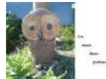
En meer dan potten