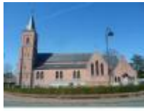
Sint-Niklaaskerk in Meigem