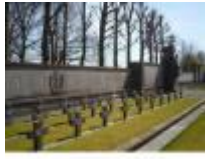
Oorlogsmonument 1940 in Vinkt