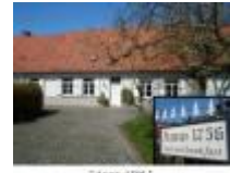
"Anno 1756" met ontbijt en koffie in Vinkt