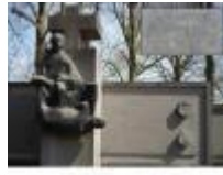
"Waar toe de mens in staat is"