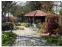
Met een gezellig terras voor "koffie met gebak" of "een Potteloereke"