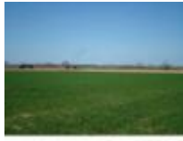
Tussen de dorpen, ben je echt wel "te lande"