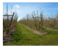
Hectaren vol met fruitbomen