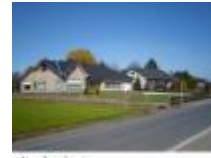
Van hier komt de wielergeneratie "Planckaert"