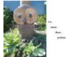
En meer dan potten