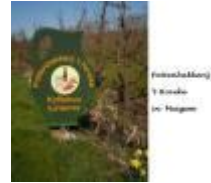
Pottenbakkerij 't Hoveke in Meigem