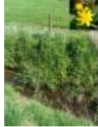
Hier is de lente, maar alle seizoenen zijn mooi