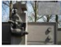
"Waartoe de mens in staat is"