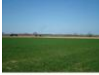
Tussen de dorpen, ben je echt wel "te lande"