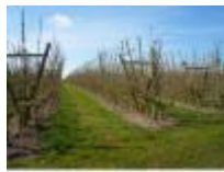
Hectaren vol met fruitbomen