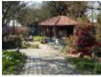
Met een gezellig terras voor "koffie met gebak" of "een Potteloereke"