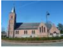
Sint-Niklaaskerk in Meigem