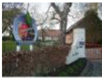
Fruitbedrijf "Cocquyt" in Meigem