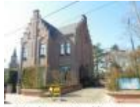
Mooi gebouw met toepasselijke naam "Rechts van de Kerk"