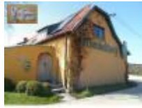
"Van Gompel" de pottenbakker