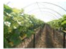
En het is hier ook de streek van aardbeien