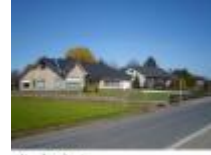
Van hier komt de wielergeneratie "Planckaert"