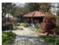
Met een gezellig terras voor "koffie met gebak" of "een Potteloereke"