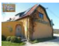
"Van Gompel" de pottenbakker