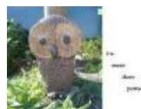
En meer dan potten