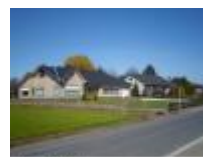
Van hier komt de wielergeneratie "Planckaert"