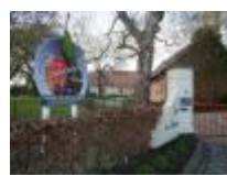
Fruitbedrijf "Cocquyt" in Meigem