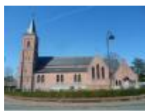
Sint-Niklaaskerk in Meigem