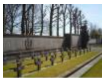
Oorlogsmonument 1940 in Vinkt