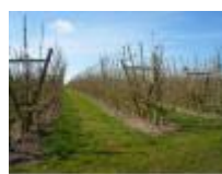
Hectaren vol met fruitbomen