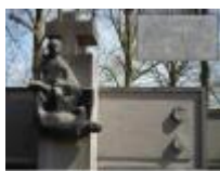
"Waartoe de mens in staat is"