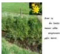
Hier is de lente, maar alle seizoenen zijn mooi