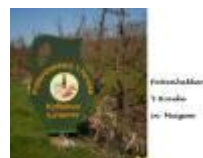
Pottenbakkerij 't Hoveke in Meigem