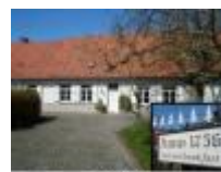
"Anno 1756" met wandelbroekje in Vinkt