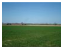
Tussen de dorpen, ben je echt wel "te lande"