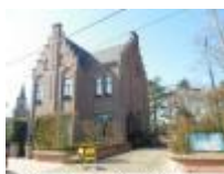
Mooi gebouw met toepasselijke naam "Rechts van de Kerk"