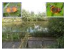
Oude Leie in Grammene