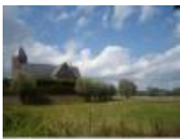
Kerk en Vierendeelbrug in Grammene