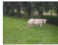
'Belgisch Wit Blauw' of 'Blanc Bleu Belge' het bekendste Belgische runderras