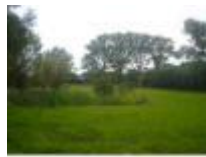
Grasland met veel vochtige plaatsen