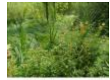
Een prachtig stukje ongerepte natuur