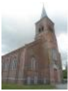
Sint-Agnus kerk in Wontergem