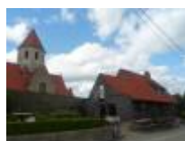
Gotten, kerk en brouwerij naast mekaar