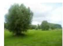
Typisch zicht voor deze streek