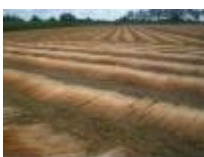
Gotten - Vlasdorp