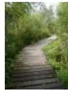
Houten wandelpad door een natuurgebied