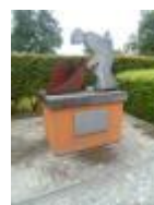
'De Vlasser' kunstwerk in Gotten