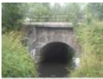
'Bogen-Brücke' gebouwd in 1940 door het Duitse Bau Bataillon 83