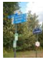
De Leiestreek wandelen of fietsen, er is veel keuze