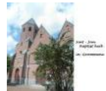
Sint-Jan Baptist kerk in Grammene