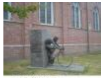
Standbeeld Lucien Buysse in Wontergem