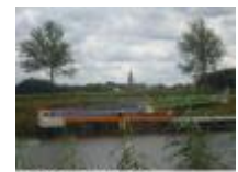
Aanlegsteigers in de Leie voor een bezoek aan Machelen