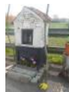
Hoe oud is dit kapelletje ?