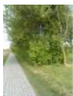
Mooie berm voor de vogels en andere diertjes