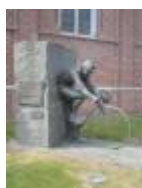
Wontergem, het dorp van Lucien Buysse