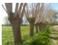
Leielandschap in de lente