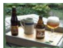
Huisbrouwerij Sint-Canarus in Gottem