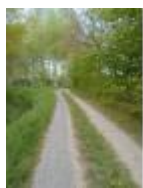
Dorp en natuur zijn hier dicht bij mekaar