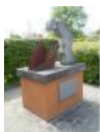
"De Vlasser" Kunstwerk in Gottem