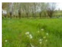
Natuur, zoals het vroeger was