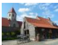
Sint-Canarus in Gottem "Klein brouwerijtje" met "Grote bieren"