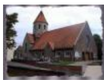
St-Martinus en Eutropius, kerk van Gottem