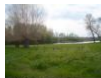
Af en toe zie je nog een stukje "Oude Leie"