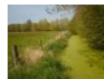
Waar natuur nog natuurlijk mag zijn